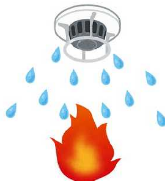
スプリンクラー設備