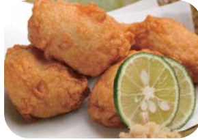
『さつま揚げ』居酒屋 ひばり 内灘町字向栗崎 2-75 076-238-3625