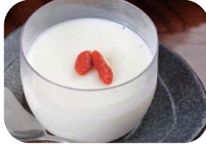
『うちなだミルクの杏仁豆腐』鳥珍や 内灘町字大根布 6-109 076-286-2939