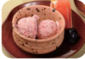
『自家製アイス』九州台所 八兵衛 内灘町字鶴ヶ丘 1-389 076-286-5055