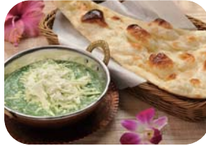
『ほうれん草と自家製チーズカレー』るびな・はいざい 内灘町字大根布 7-120 076-286-6328