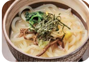
『韓国風うどん』焼肉屋 sun ひまわり 内灘町字大根布 7-132 076-255-0744