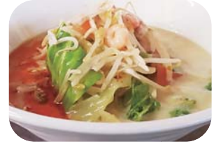
『内灘ミルクちゃんぽん』らーめん la.la.la. 内灘町字向栗崎 2-247 080-2956-5520