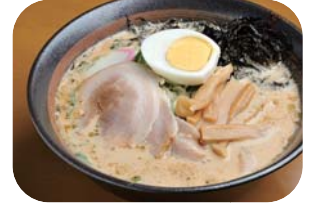
『牛乳ラーメン』カーデカフェ ブラウンスイズ 津幡町字湖東 245 076-254-1545