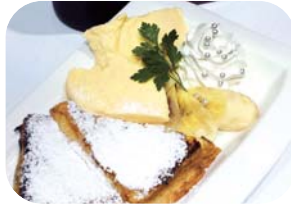
『トロトロフレンチトースト』とん喜 内灘町字鶴ヶ丘 3-157-13 076-286-6885