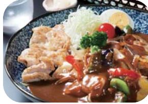
『季節の野菜カレー』はづ貴 内灘町字鶴ヶ丘 4-1-159 076-286-1810