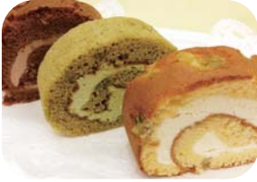
『うちなだロール(プレーン・抹茶ココア)』ひまわりポンポン 内灘町字千鳥台 4-1川'おれ'丸内 076-237-3707