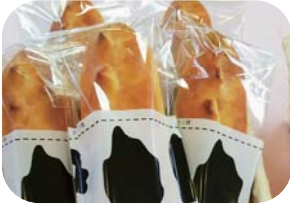
『ミルクぼん』フリーズ ドゥ メール 内灘町字緑台 1-306-29 076-239-3018