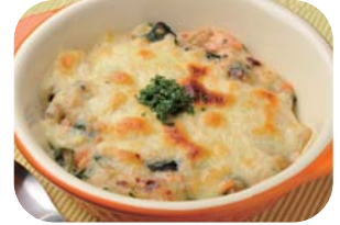
『季節のグラタン』くろぎ屋 ZEN 内灘町字向栗崎 1-316 076-237-0987