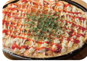
『ふわとろチーズオムレツ』炭火焼肴居酒屋 しんちゃん 内灘町字向陽台 1-186川'サイド'1F 076-238-1948