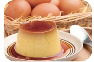
『ほっこりプリン』Poco a Poco 内灘町字湖西 316 076-5063-9282