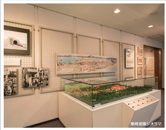
粟崎遊園ジオラマ