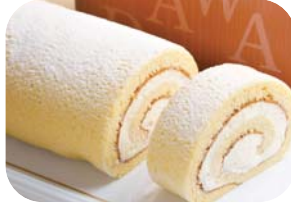
『ミルク王国ロール』リッチ・モント 内灘町字向栗崎 2-52 076-255-0358