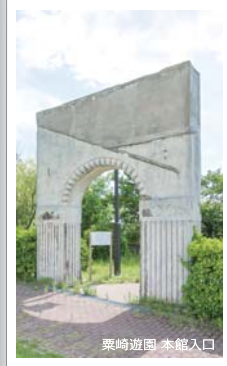
粟崎遊園 本館入口

内灘町の歴史や文化を紹介する資料館。粟崎遊園、内灘闘争、内灘の民俗と歴史などを紹介しています。また、毎年内灘海岸で開催される「世界の凧の祭典」にちなんで、日本や海外のさまざまな凧の展示も見ものです。