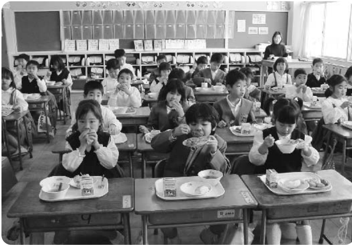
学校給食（大根布小学校）