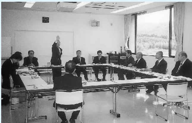
村長を交え意見交換

わかりやすく親しみやすい議会広報づくりは全国共通であるため、様々な観点からの見方、考え方を研修することができ、紙面づくりの大切さと審議内容の表現方法に有意義な成果を得られました。