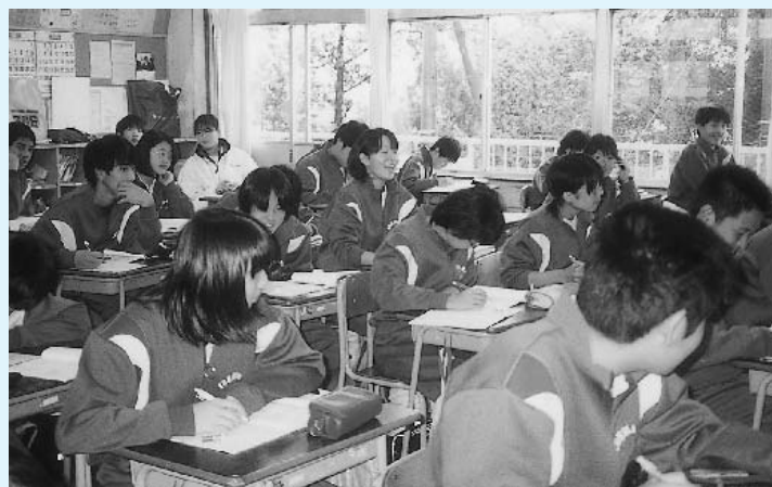
授業している生徒

特にスポーツ面では、先輩が後輩を指導する伝統が受け継がれていました。また、学級相互の意志疎通、指導の一貫性、情報の共有、全体での実践など反省点が生きる機能的、効率的な組織運営を進めていました。