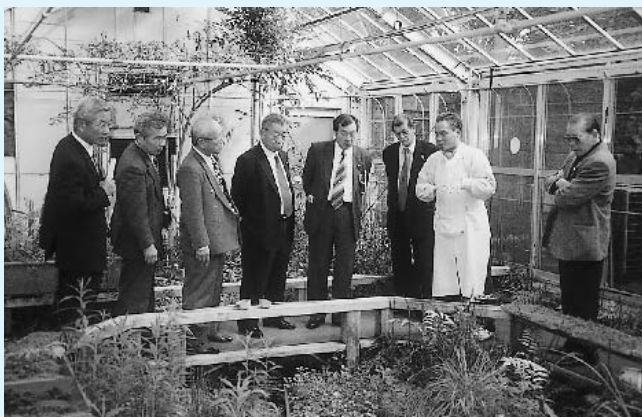
「せせらぎ」を観察する委員

メイン施設となる「せせらぎ」は、ガラス温室内にあって、全長17m、幅1.2mの小川が流れており、水はろ過されて循環されています。可能な限り生息地の気象状況に近づけるようにしてあり、ホタルの自生地を再現しているようでした。