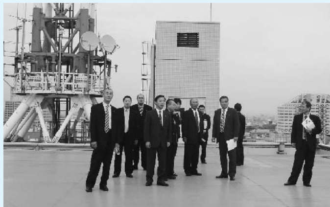
ヘリコプターの緊急離発着場

貴重な財産を守り、尊い人命を保護し、住民生活の安定向上に寄与することにあります。 立派な施設があっても消防団との連携を密に保っている姿勢は参考になりました。