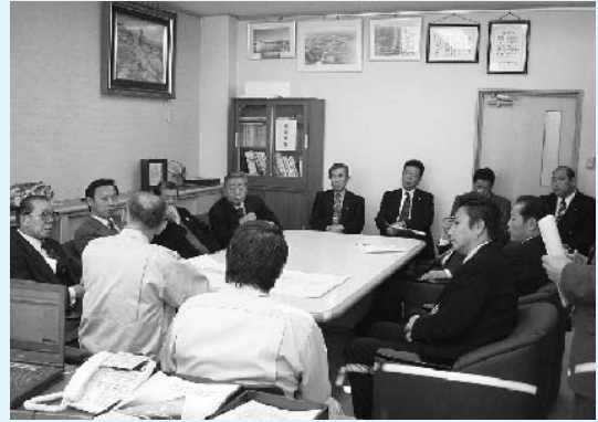
津幡土木事務所で要望する委員