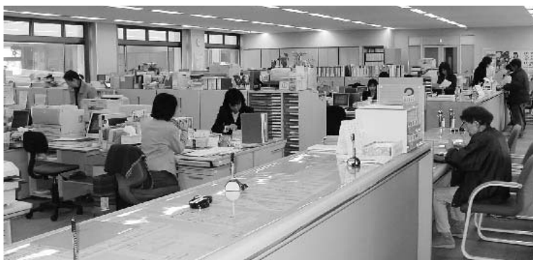
役場1階カウンター

西荒屋小学校が山間部の学校との地域間交流、内灘砂丘での自然観察等の体験学習推進事業の補助金として、50万円を計上。