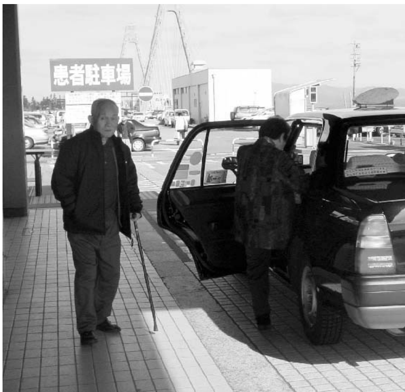
福祉タクシーの利用拡大を